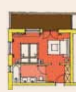
14 Familienzimmer / Suiten (ca. 30 m 2 )